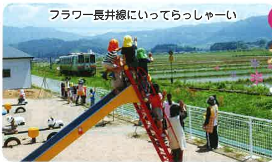
フラワー長井線にいったらっしーい