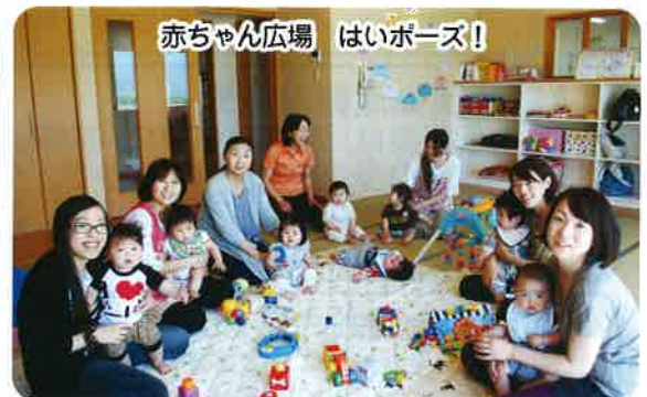
赤ちゃん広場 はいポーズ！