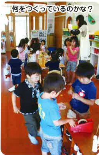
何をつくっているのかな？

関係者みなさんのおかげで四月一日同施設がオープンしました。「さくらの保育園」は一九四名の児童が入所しました。こぐわ保育園とあゆかい保育園が統合し、新たな環境の中ですが子ども達はすぐに慣れ、毎日元気に飛び回っています。