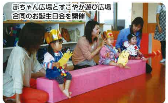
赤ちゃん広場とすこやか遊び広場 合同のお誕生日会を開催

「子育て支援センター」は、「遊び広場」や「赤ちゃん広場」など毎日多くの方にご利用いただいています。日曜日、祝日(五月連休、お盆、年末年始を除く。)についても開館しておりますので是非ご利用ください。 「放課後児童クラブ」は、蚕桑小学校、鮎貝小学校から三十人を超える子ども達が通所しています。施設内は、子ども達の元気な声が響いています。 スタートして二カ月、地域の皆さんの協力をいただき順調に運営されています。今後ともご協力、ご支援をお願いします。