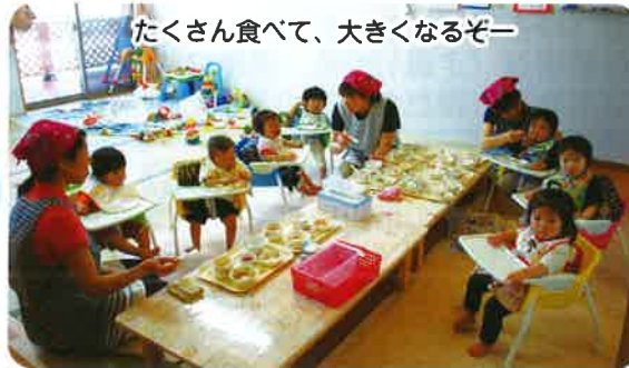
たくさん食べて、大きくなるぞー