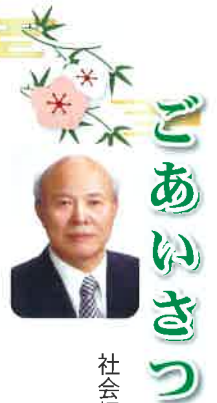
社会福祉法人白鷹町社会福祉協議会