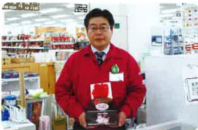
マックスバリュ東北株式会社白鷹店 様

イオングループでは、全国の各店舗で募金活動にご協力をいただいています。今年、白鷹店の職員の方々にご協力いただきました。