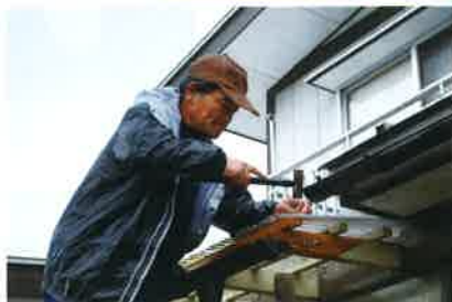
左の写真 なみ板を固定

地域の民生委員が対象となる世帯の要望を取りまとめ、作業現場を民生委員の立会いの下、事前調査に入ります。当日必要とする機材や材料を確認し作業を進めています。ボランティアさんから高齢者の方々に、「他にないか」「困っていることないか」と何度も声がけをして、安心して冬を越すことができるように対応していただきました。