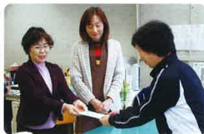
白鷹町商工会女性部 様

イオングループでは、全国の各店舗で募金活動にご協力をいただいています。今年、白鷹店の職員の方々にご協力いただきました。