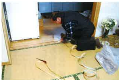
右の写真 敷居すべりを交換

十一月十日（日）、白鷹町商工会建工部会による家屋補修のボランティア活動が行われました。この日は、小雨が降る肌寒い日でしたが、ボランティアの皆さんに八件の対象世帯の家屋を補修していただきました。