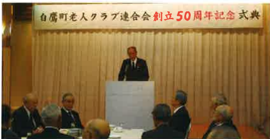
白鷹町老人クラブ連合会 創立50周年記念 式典